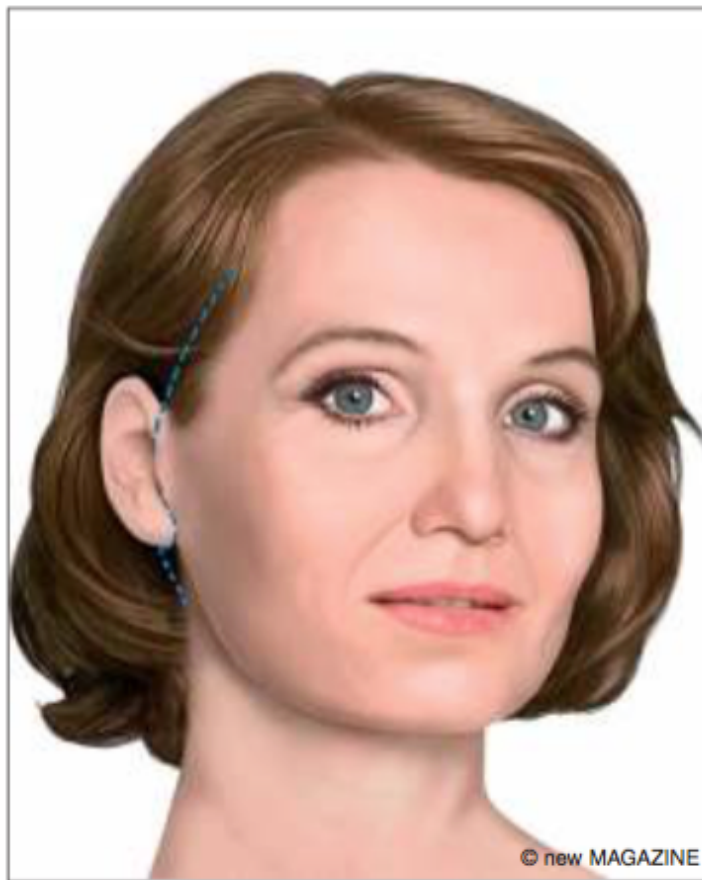
Figura 6. Lifting cervico-facciale: in evidenza le incisioni.

Dopo questo tipo di intervento, il dolore non è forte e di norma è controllabile con i comuni analgesici. Dovrà essere evitato l'uso di farmaci contenenti acido acetilsalicilico che potrebbero provocare sanguinamenti e quindi la formazione di ematomi. Spesso il dolore coincide con la sensazione di tensione, ovviamente connaturata a questo tipo di intervento, alla quale ci si abitua progressivamente fino a non avvertirla più dopo alcune settimane. L'insorgenza di un dolore forte e persistente e/o di un improvviso gonfiore in qualche parte del volto potrebbe significare lo sviluppo di un ematoma ( vedere complicazioni ). In questo caso è necessario informare tempestivamente il Chirurgo.